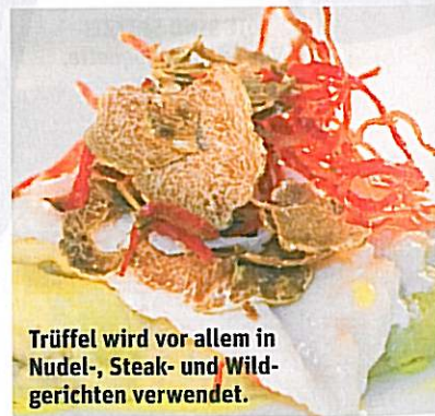
Trüffel wird vor allem in Nudel-, Steak- und Wildgerichten verwendet.