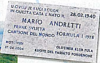
Was nur wenige wissen: Im Bergdorf Motovun erblickte Rennfahrer Mario Andretti das Licht der Welt.