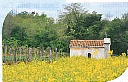
Saftiges Grün und blühende Wiesen prägen im April und im Mai das Hinterland der Küste.