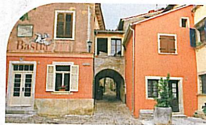
Galerie an Galerie, verwinkelte Gassen und Torbögen im Künstlerdorf Grožnjan.