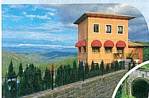
Perfekte Mountainbike-Route auf der Trasse der stillgelegten Schmalspurbahn Parenzana von Triest nach Porec.