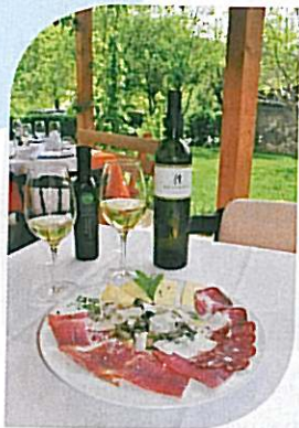
Prsut, Käse und wilder Spargel im Bilderbuch-Landgasthaus Stari Podrum in Momjan.