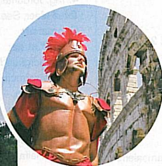
Pula: Ein römisches Amphitheater und stille Buchten direkt am Lungomare-Weg südlich der Stadt.