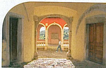
Geheimtipps: In Oprtalj lohnt sich der Blick durchs Stadttor. Kurz vor Šterna ergießt sich ein versteckter Wasserfall in eine Doline.